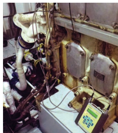
Fig. 1: Mediciones de consumo en motor principal.

Tribuna Profesional cuenta con el patrocinio de: